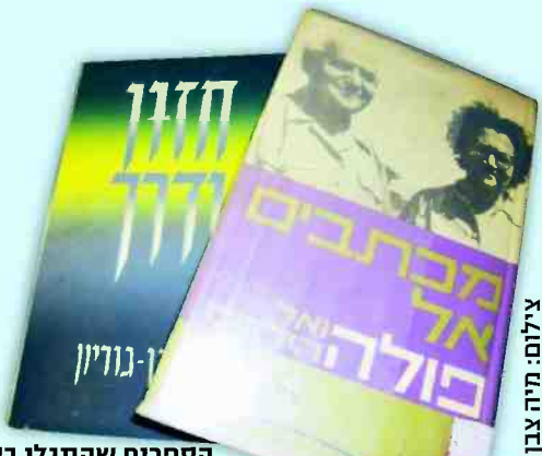
הספרים שהתגלו בספרייה